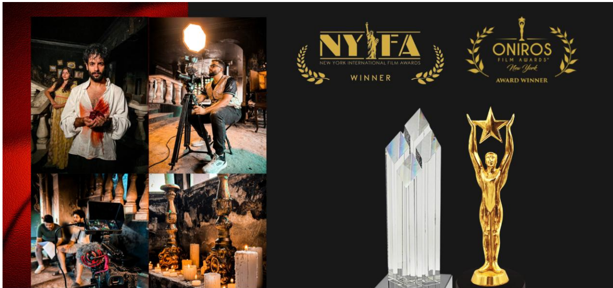
Curta Metragem Sonhos Alados Premiado como Melhor Fotografia e Melhor Roteiro em Nova York Setembro de 2024