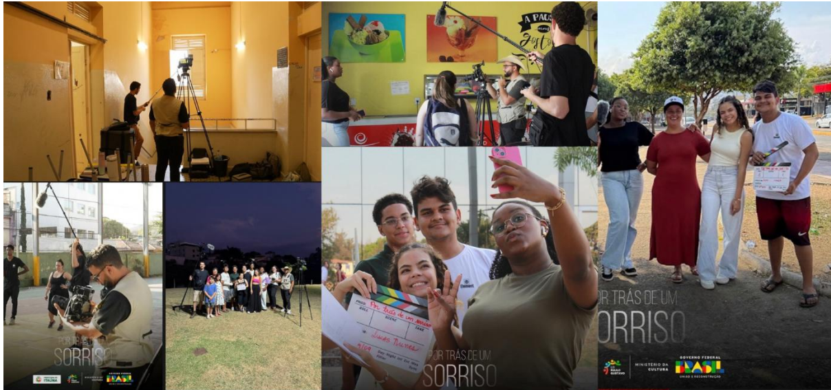
Direção, Filmagem e Edição do Curta Metragem "Por Trás de Um Sorriso" que foi filmado com alunos da Escola Estadual de Itaúna, que receberam também oficina sobre audiovisual. Novembro de 2024