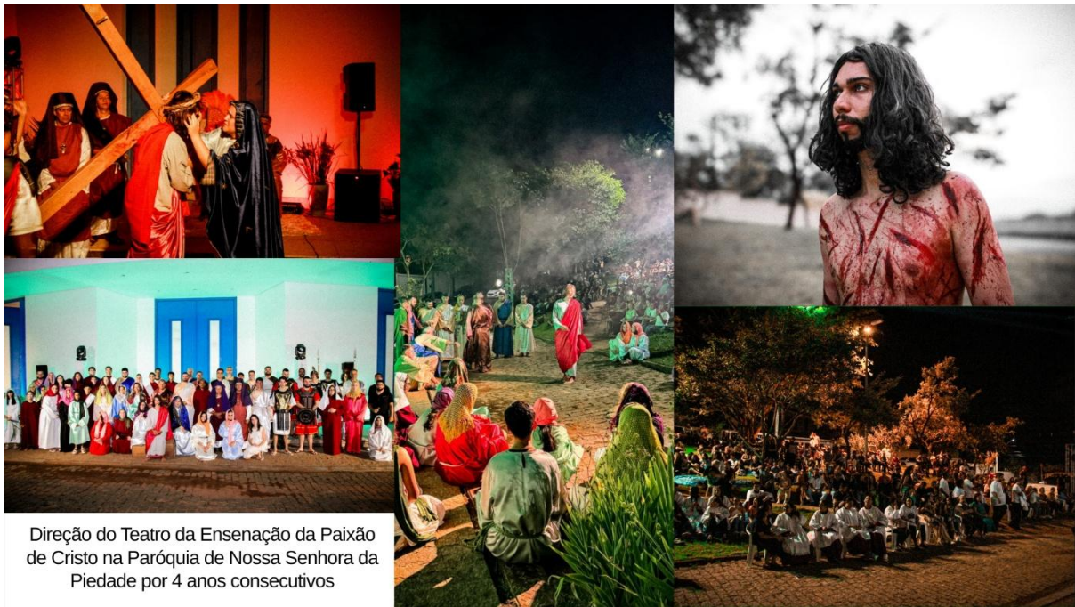
Direção do Teatro da Enseñação da Paixão de Cristo na Paróquia de Nossa Senhora da Piedade por 4 anos consecutivos