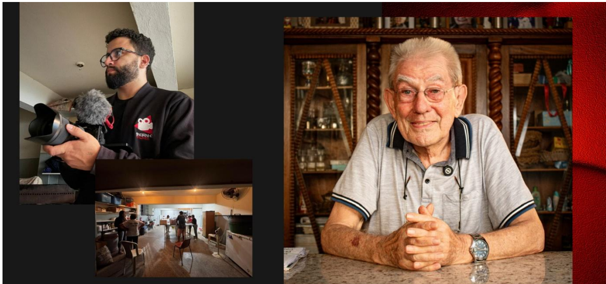
Documentário "Gotas de Esperança: retratos da vulnerabilidade social" mostrando a realidade das pessoas em situação de rua e dos agentes que lidam com esse público - Dezembro de 2025