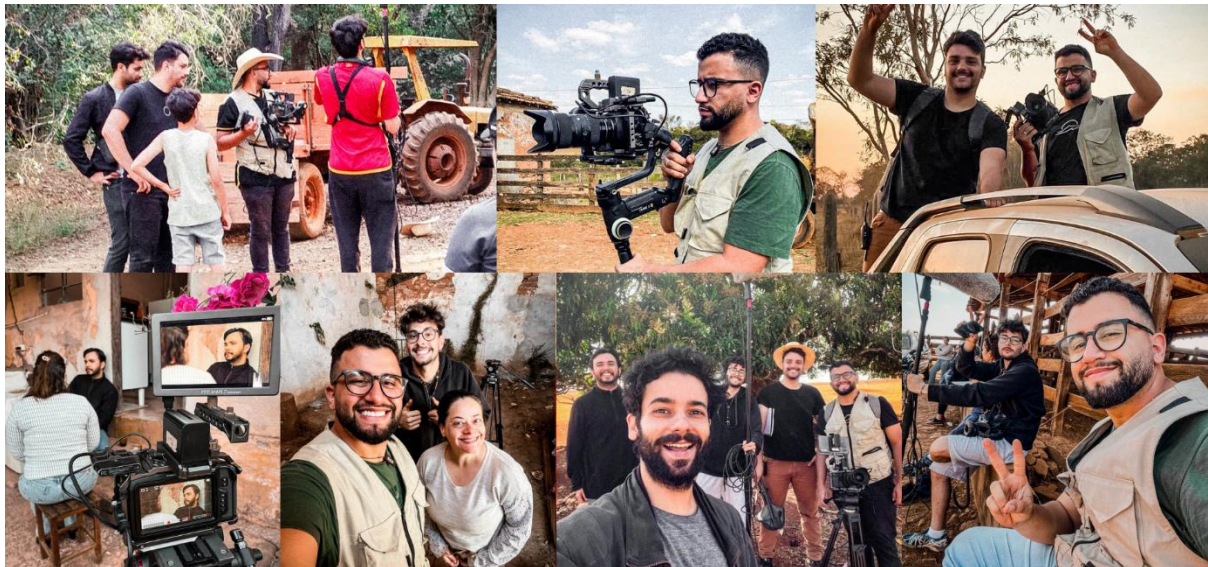
Gravação do Longa Metragem "A Eternidade do Hoje" em Lagoa da Prata - 2024