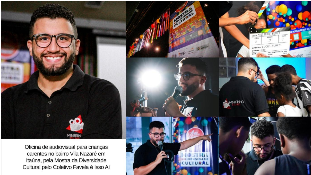
Oficina de audiovisual para crianças carentes no bairro Vila Nazaré em Itaúna, pela Mostra da Diversidade Cultural pelo Coletivo Favela é Isso Aí